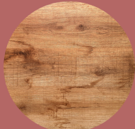
Vacante ÁREA 2